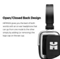
Open/Closed Back Design

HiFiMAN gives you the best of both worlds with an on-ear headphone that can go from one mode to the other simply by adding (or removing) the high cap on the ear cup.